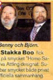
Benny och Björn.